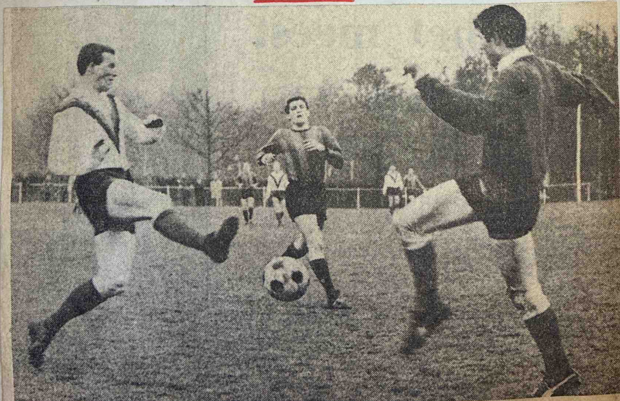
VDZ-QUICK N. 3-1 — Door tijdig het doel uit te komen kan de Nijmeegse keeper een aanval van VDZ afslaan. Opmerkelijk was het overigens dat het grote Arnhemse overwicht niet meer doelpunten opleverde.