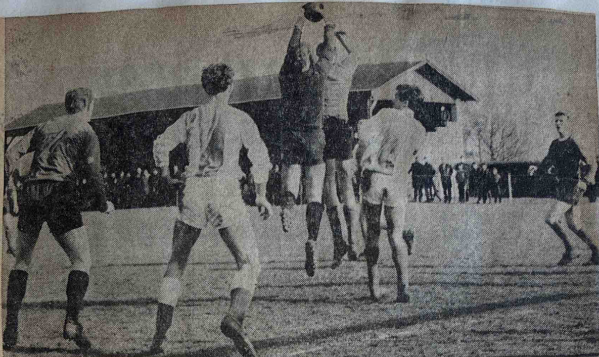
VDZ—BE QUICK 1—2. — De voortreffelijke doelman van Be Quick was bijna keer-op-keer de VDZ-aanval te snel af. De topper in de tweede klas A eindigde in een verdiende overwinning voor de Zutfense ploeg.