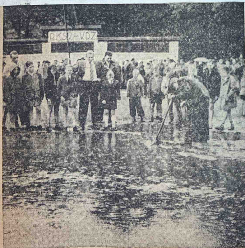
De wedstrijd V.D.Z.—Leones moest worden afgelast tengevolge van een enorme stortbui, die even vóór aanvang van de match losbarstte en het terrein in no-time onder water zette. Men probeerde van alles om het water te keren, maar zonder succes. De scheidsrechter keurde het veld af. En het druipe publiek droop toen maar af.