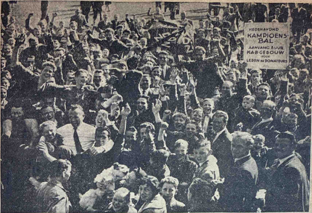
Onmiddellijk na de wedstrijd stormden de supporters het veld op om hun kampioenen in triomftocht naar de kleedkamer te dragen.

ARNHEM, 13 mei. — Met 6—1 heeft het Arnhemse VDZ de mannen uit Gaanderen van zich afgeschud en daarmee de zo fel begeerde kampioenstitel van de derde klasse C voor zich opgeëist. Een mooie wedstrijd hebben de ca. 2000 toeschouwers, die het zonnovergoten Craneveld omzoomden, niet gezien; de zenuwen speelden immers aan weerskanten een te grote rol, vooral in de eerste helft toen beide doelen dikwijls onder zware druk kwamen te staan. Het eigenaardige is nu dat VVG in deze eerste speelhelft zeker niet de mindere was van de rood-zwarten, maar desondanks met rust een 4—1 achterstand boekte. Wel een bewijs dus dat de gastdoortastender waren, een veel grotere produktiviteit aan de dag legden, al moet gezegd worden dat de VVG-achterhoede verschillende kostbare steken liet vallen.