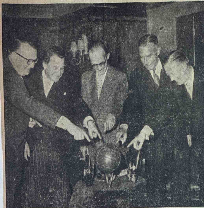
Lachend wijzen de VDZ-bestuurders naar het geschenk, dat zij van „De Hanze” ontvingen. Nu maar te hopen dat de nieuwe „aanwinst” in het komende seizoen tal van malen in het vijandelijke doel zal tolleren.