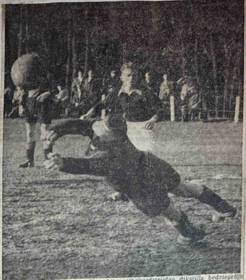
VDZ-EDE 5-0. — Dat cijfers bij voetbalwedstrijden dikwijls bedriegelijk zijn wordt door deze uitslag weer eens bewezen. Een flinke overwinning voor de Arnhemmers, hoewel het spel van VDZ maar zeer pover was. De Arnhemse doelverdediger is er juist iets eerder bij dan de Edenaren, die met grote aandacht de verrichtingen van de bal en van de keeper volgt.