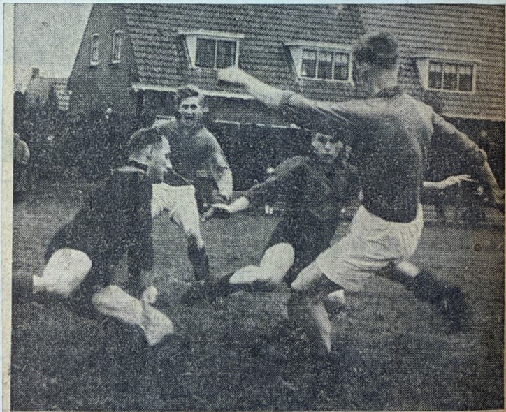
WAVV-VDZ. — Twee WAVV-ers in actie voor het VDZ-doel. Zo te zien maakt de Arnhemse achterhoede een goede kans het gevaar te keren.