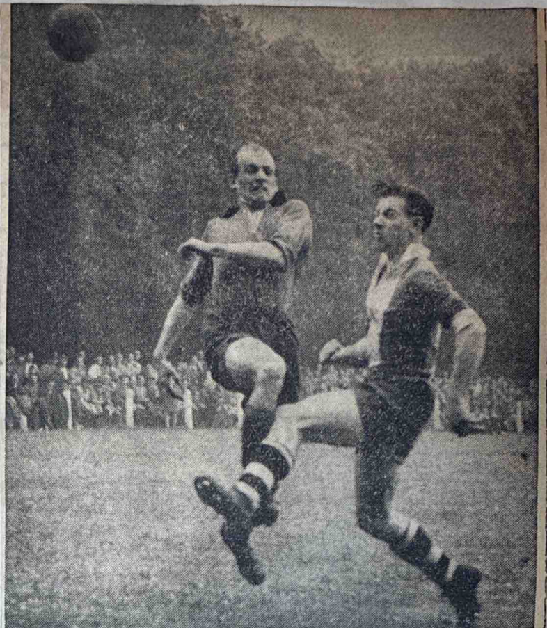
Hoe de duels bij V.D.Z.—M.V.V. '29 waren, kan men op deze foto zien: grimmig en wat onbehouwen. Hetgeen van weinig lichaamsbeheersing getuigt.