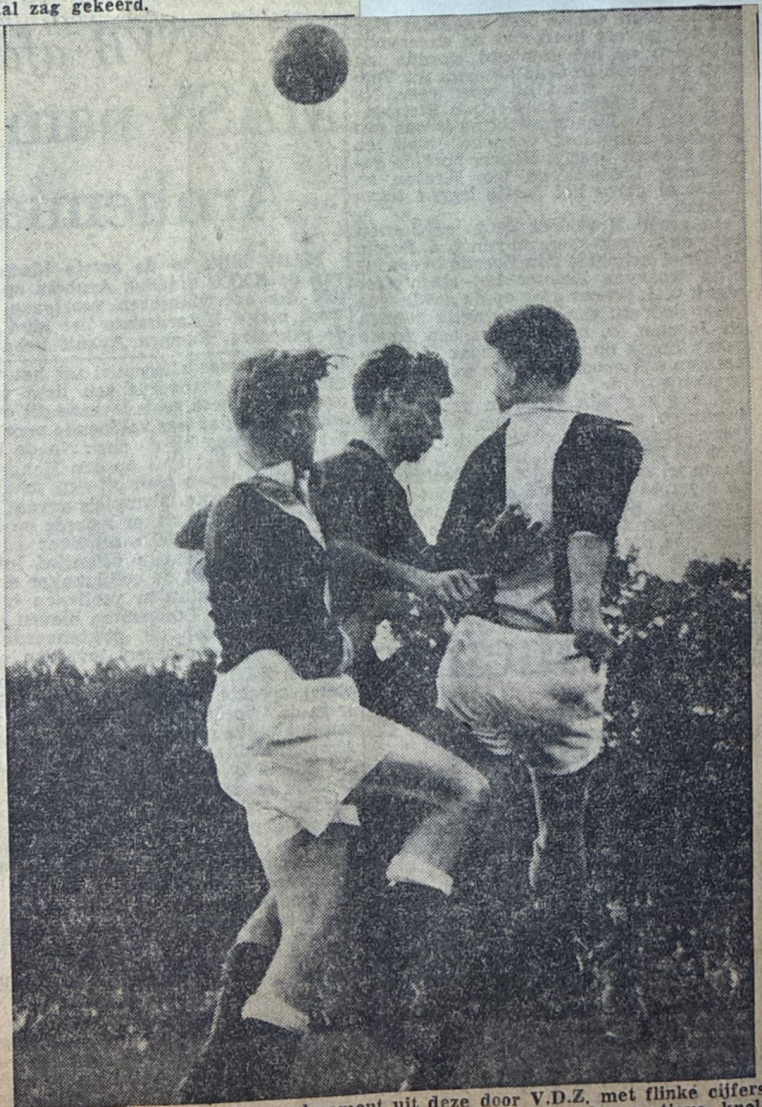
V.D.Z.—V.V.O. 3-0. — Een spelmoment uit deze door V.D.Z. met flinke cijfers gewonnen wedstrijd. Zo te zien zit de VDZ-speler aardig in de sportieve knel.