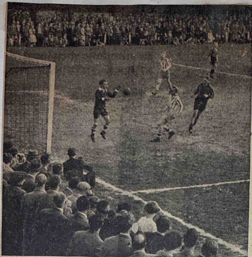
VDZ—VVG 6—1. — Een spelmoment van deze uiterst belangrijke wedstrijd, die VDZ het kampioenschap bracht. De foto geeft tevens een aardig overzicht van de drukte, die er op het VDZ-terrein heerste.