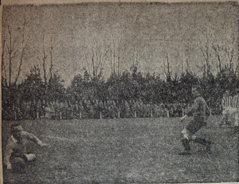
VDZ—ARNHEMSE BOYS 2—2. — Het tweede doelpunt van VDZ in de plaatselijke wedstrijd tegen Arnhemse Boys, gescoord door van de Berg. Op de achtergrond de verdedigers van Arnhemse Boys, die — wegens buitenspel? — niet ingrepen