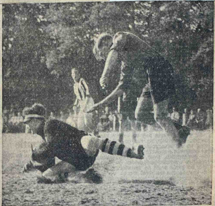
VDZ-SILVOLDE 3-1. — De keeper van Silvolde onderschept vallend een gevaarlijke aanval van VDZ. De middenvoor van VDZ kwam dan ook tijdst iets te laat om nog een kans te hebben