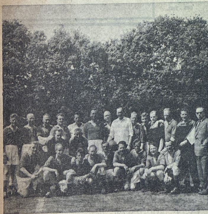
De veteranenteams van VDZ en Neuss Weiszenberg, die gistermiddag op het Craneveld de spits afbeten tijdens de sportuitwisseling.