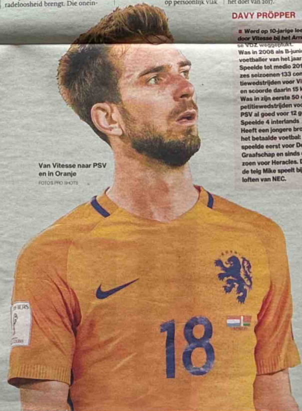
Van Vitesse naar PSV en in Oranje