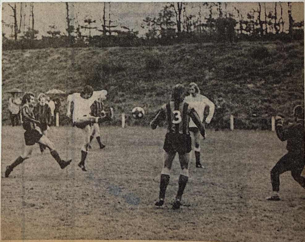
Dringt VDZ door tot de districtsbekefinale?