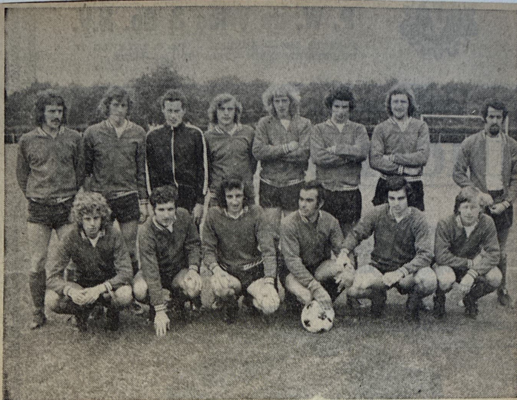
Het elftal van VDZ.