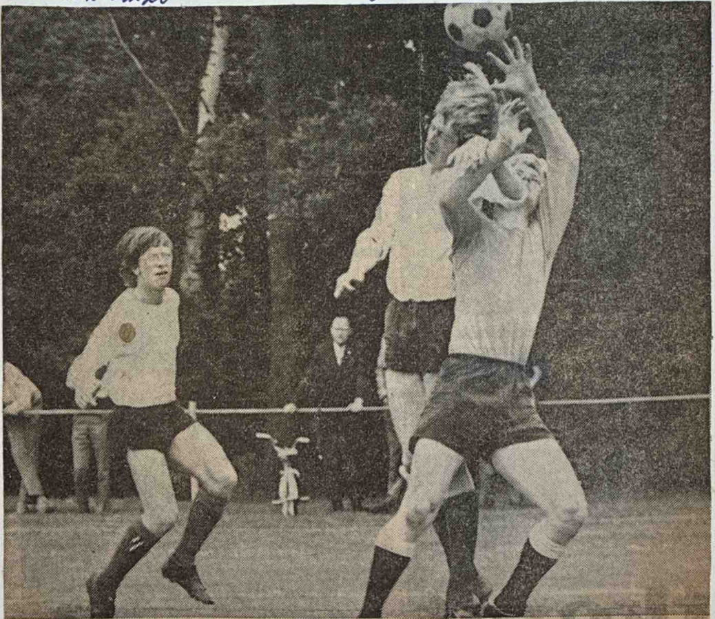
VDZ in de bekerwedstrijd tegen Labor.