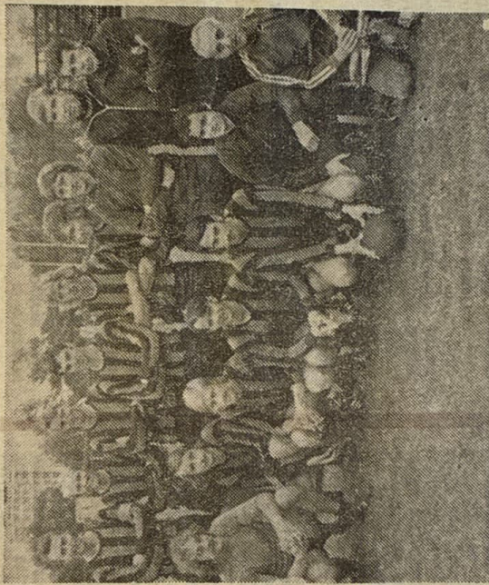
★ Het elftal van VDZ, dat zo hoopvol aan de competitie begon.