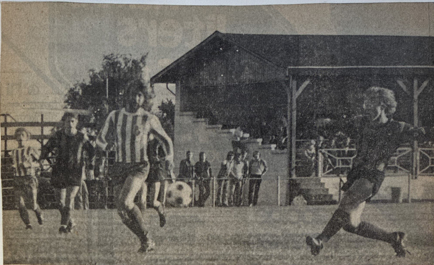
VDZ dacht aan een doelpunt tegen Wageningen maar het feest ging wegens buitenspel niet door.