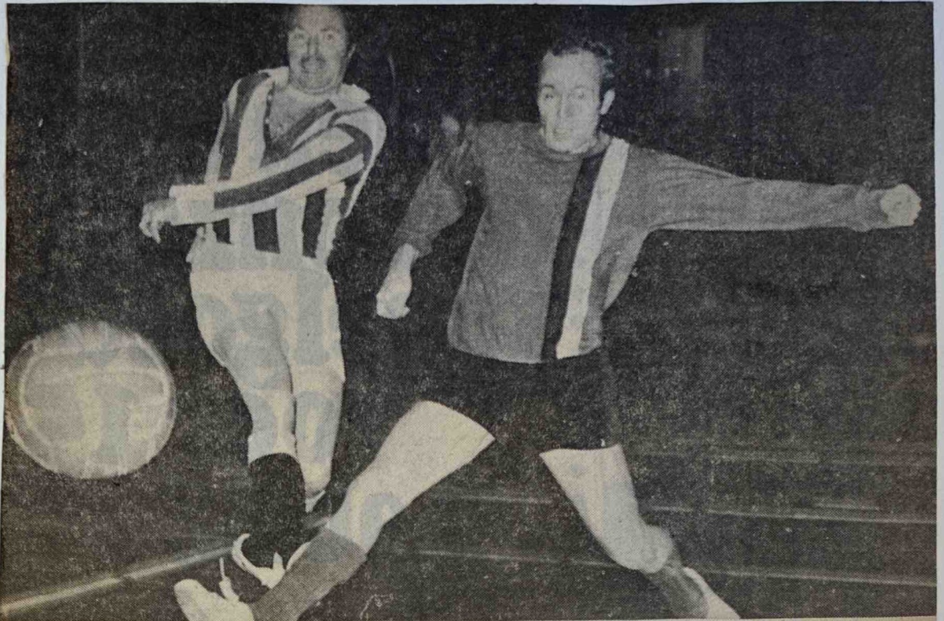
Deze aanval van Vitesse tegen VDZ zal niets opleveren.