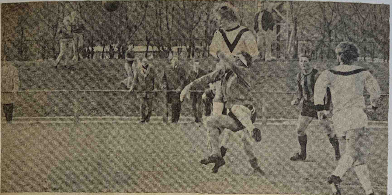
De VDZ-doelman zit tegen Rheden danig in het nauw.