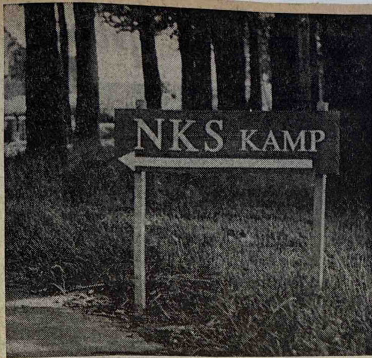
Linksaf naar het NKS-kamp.