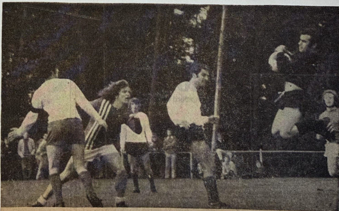
● VDZ-doelman Egging onderschept een aanval van Jonge Kracht.