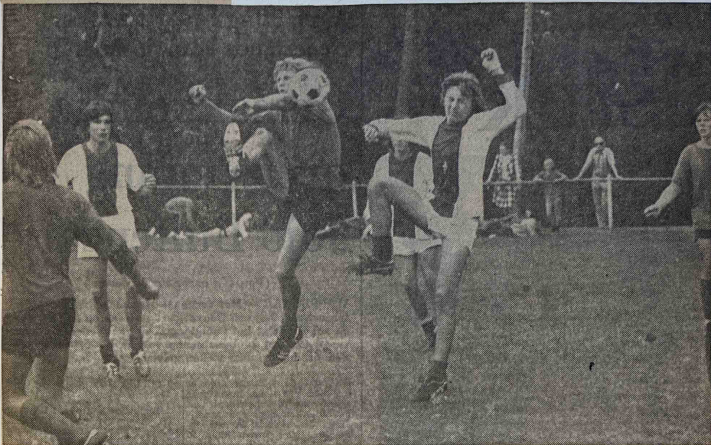
Een spelmoment uit de wedstrijd VDZ-Doesburg (Comma ndeur-toernooi) .