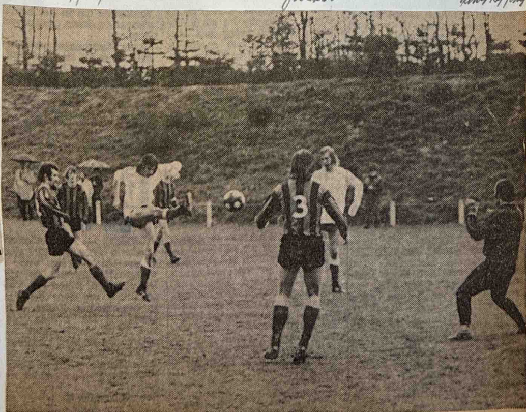
Het eerste doelpunt van OAB in de maak

Dat gebeurde dan ook. O.A.B. bleef onverdroten aanvallen maar verder dan een schot tegen de lat kwam men voorlopig niet. Tussen de bedrijven door leek V.D.Z. de score te gaan openen toen er bij een tegenaanval van de roodzwarten