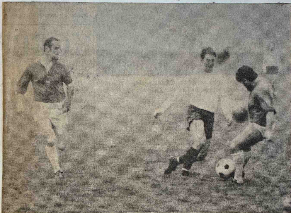
VDZ en Hatert aan het werk op 't Cranevelt.

VDZ, dat aanvankelijk niet zo'n beste start had, sluipt onopgemerkt naar de top. Met 8 uit 8 staat het op de vijfde plaats maar lijstaanvoerder Eldenia heeft 10-3, zodat het verschil in deze derde klasse D wat betreft de kopgroep maar heel klein is. De Arnhemmers ontvangen thuis rode lantaardrager Hatert.