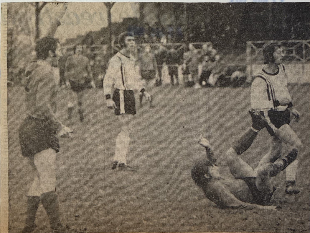
VDZ—SCE: een afgekeurd doelpunt van VDZ