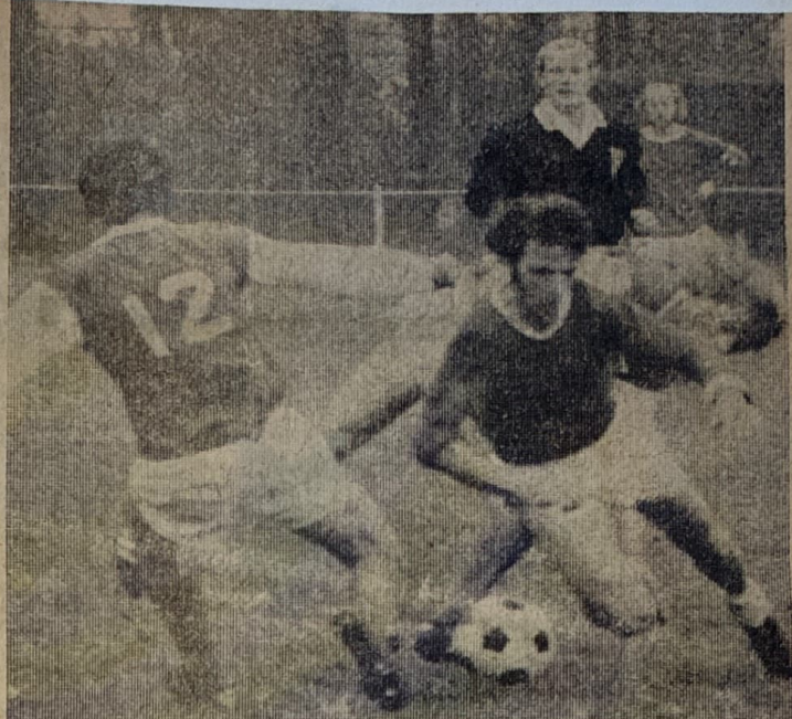
● Een speler van Jonge Kracht in een ongelijk duel gewikkeld met twaalf spelers van VDZ.