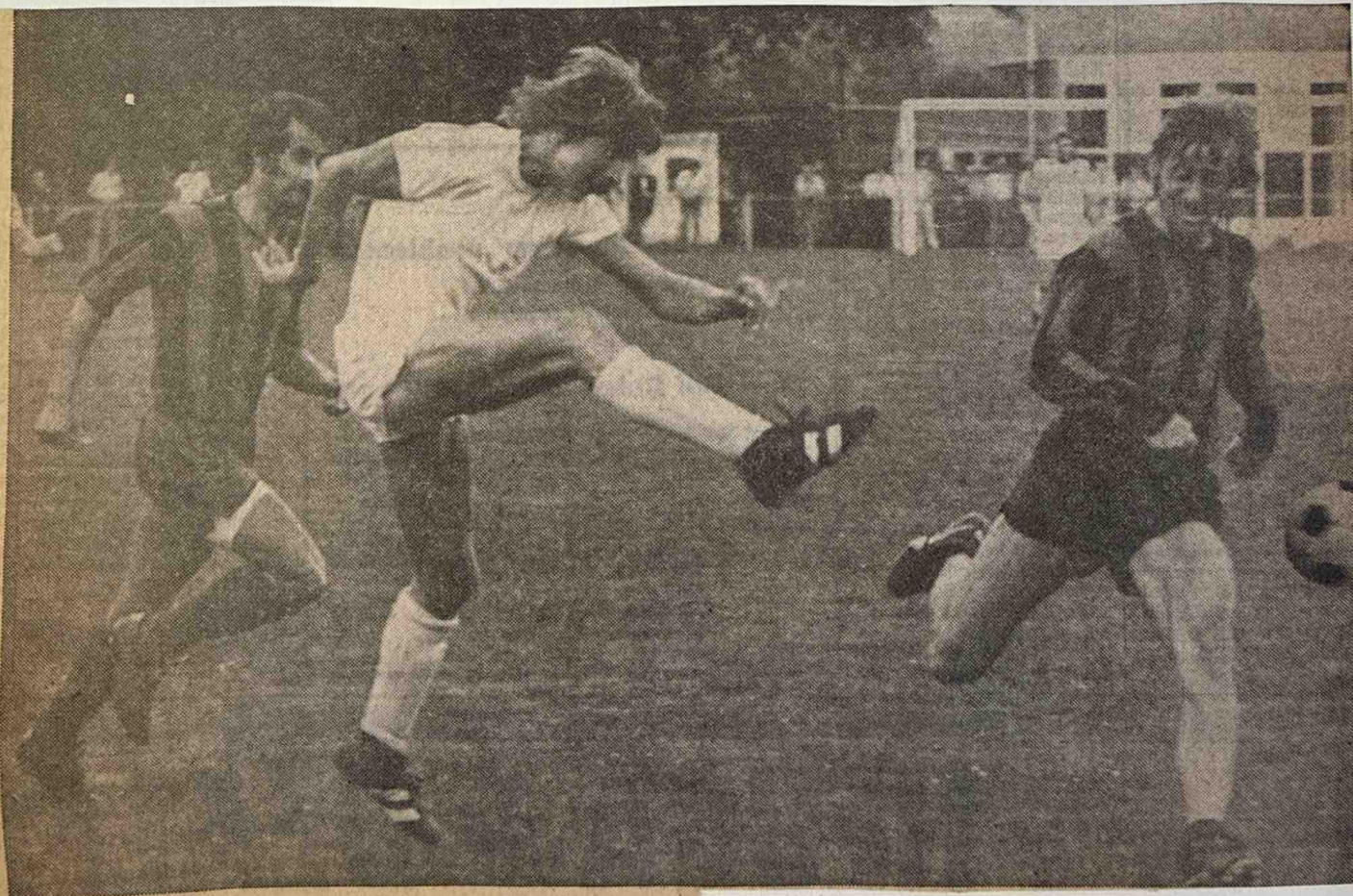
De Graafschap knalt er op los bij VDZ.