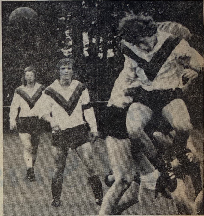
Het Commandeurtoernooi van VDZ: Quick N. in de strijd tegen Union.