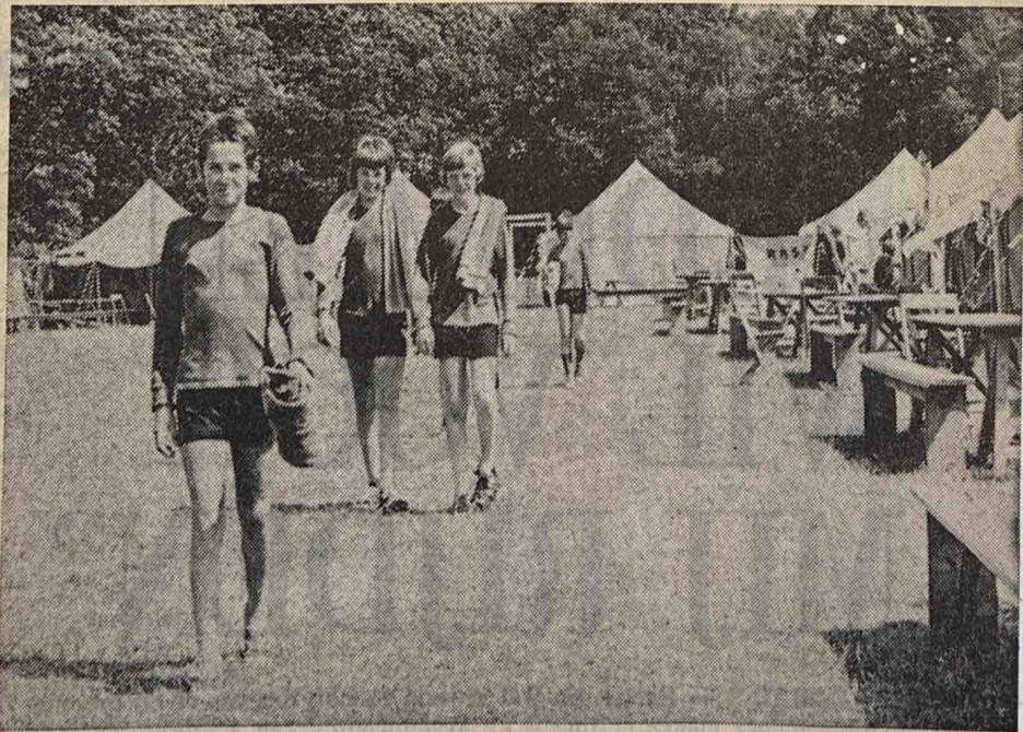
VDZ-leden op weg naar het zwembad.